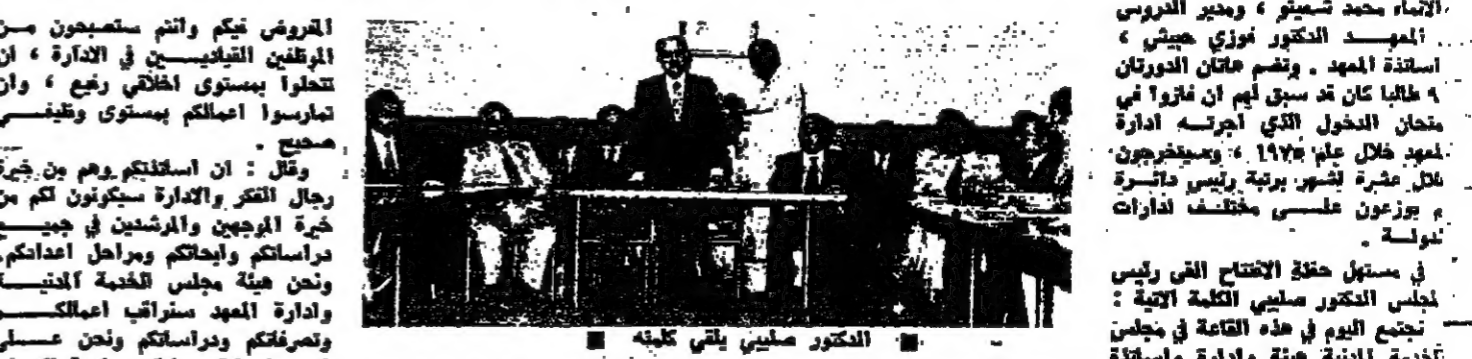
افتتاح دورتين تدريبيتين لموظفي المنة اشارة

افتتح في بيروت أمس دورتين تدريبيتين لموظفي المنة اشارة رئيس مجلس الخدمة، والقيت كلمة على مديري البناء والتصميم، والقيت كلمة على مديري التعليم والمعلمين، والقيت كلمة على مديري الإسكان والفرقاء، والقيت كلمة على مديري الإسكان والفرقاء.